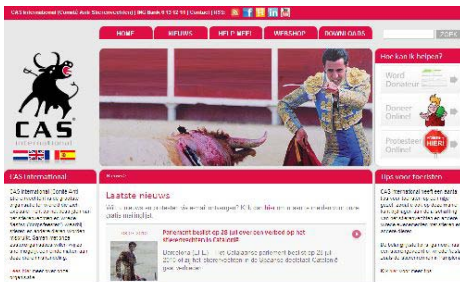
De website van CAS International sinds 2009

De website was in 2009 geheel vernieuwd. Deze nieuwe website is altijd actueel en de startpagina opent steeds met het laatste nieuws, en wel in vier talen: Nederlands, Engels, Spaans en Frans. Alle items zijn steeds zo snel en zo volledig mogelijk in alle vier de talen beschikbaar. Vanaf elke pagina kan men overgaan naar een van de andere talen, mits die betreffende pagina ook in die taal beschikbaar is. Dat is meestal wel, maar niet altijd het geval, want soms is informatie alleen voor een bepaalde doelgroep (bijvoorbeeld alleen voor Nederlandse ingezetenen) van belang.