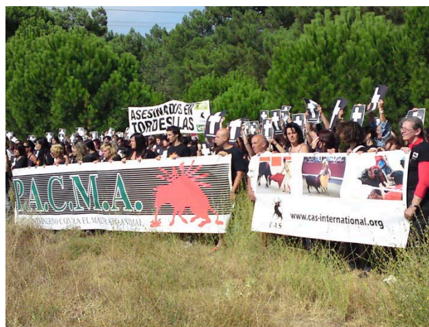
CAS International organiseerde samen met PACMA en AnimaNaturalis een protest in Tordesillas, Spanje (September 2010)

Naast de activiteiten voor het Netwerk wordt veel samengewerkt met lokale organisaties bij lobbyactiviteiten. Hiervoor is voor lobby bij de EU in 2009 zelfs een aparte groep van organisaties samengesteld. Hierin hebben zitting: CAS International (Nederland en België), ADDA en FAADA (beide Spanje), ANIMAL (Portugal), CRAC en FLAC (beide Frankrijk), Fondation Franz Weber (Zwitserland), the League Against Cruel Sports, PETA en WSPA (drie organisaties met hun zetel in het Verenigd Koninkrijk). Op andere terreinen wordt samengewerkt bij demonstraties of andere activiteiten, zoals in de vier strategische routes. Soms wordt om steun gevraagd, met name voor publiciteit (drukwerk, kranten, internetkranten, spandoeken) bij manifestaties. Als het in de begroting past, aan de criteria voor deze steun wordt voldaan en de steun ook binnen een van de projecten van CAS past, dan wordt meestal positief op dergelijke verzoeken gereageerd. CAS krijgt daardoor ook veel publiciteit in de landen waar stierengevechten plaatsvinden.