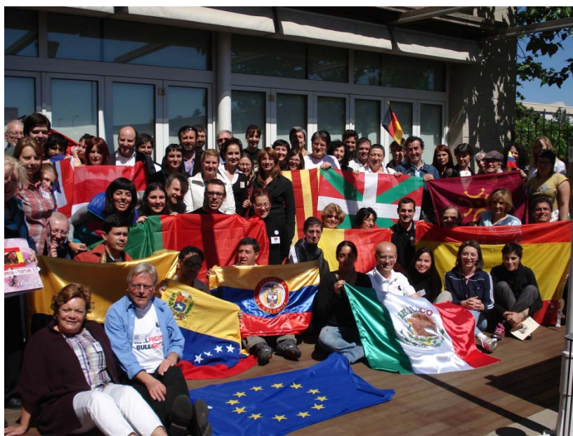
Aanwezigen op Intercontinentale Summit die CAS International ieder jaar organiseert (2010 Barcelona)

Het aantal leden van het Netwerk, dat in 2007 van start ging met 23 organisaties, is in 2010 gegroeid tot 75 (2009: 70).