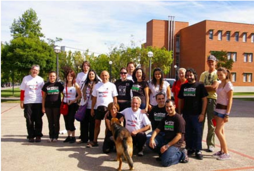
Vrijwilligers van CAS International in Logroño, Spanje (11 september 2010)

In 2010 heeft een klein aantal vrijwilligers ons geholpen op kantoor en op stands. Tweemaal werd met vrijwilligers aan demonstraties deelgenomen. De vrijwilligers betaalden zelf hun reis-en verblijfkosten. Oproepen voor deze acties worden altijd via de emailnieuwsbrief gedaan. Van actieve vrijwilligers wordt een apart bestand bijgehouden. Voorts zijn vrijwilligers actief bij protestacties via internet, bij het invoeren van adresgegevens van petities, het vertalen van teksten uit het Frans en Spaans, het geven van voorlichting op scholen, etc. Het vrijwilligerswerk is een waardevolle aanvulling op de activiteiten van de betaalde medewerkers van CAS, omdat zij het kantoor helpen bij de vele werkzaamheden of omdat ze kennis hebben die CAS niet in huis heeft.