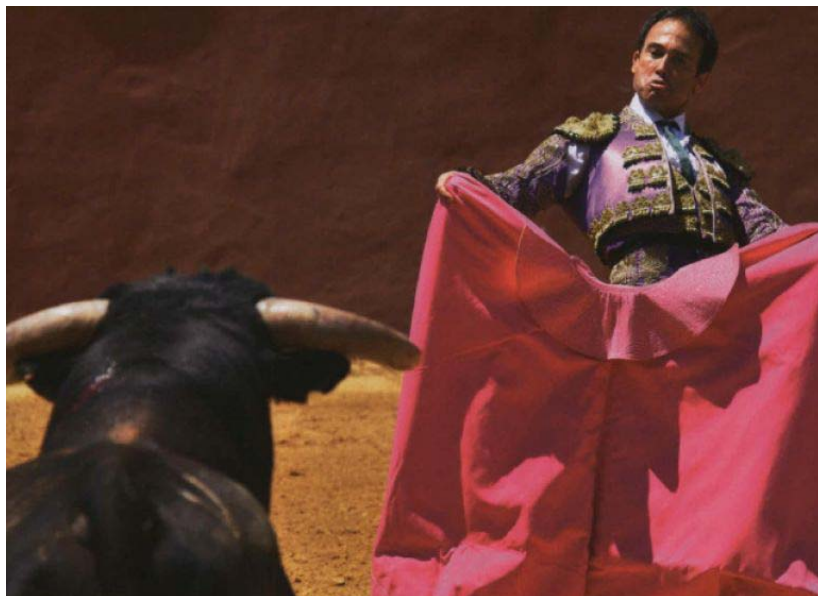
Een stierengevecht Spaanse stijl, waarbij de stier wordt gedood

Stierengevechten waarbij stieren worden gedood (en waarbij paarden worden gebruikt) vinden plaats in Spanje, Portugal, Frankrijk, Colombia, Ecuador, Mexico, Peru en Venezuela. In delen van de Verenigde Staten van Amerika vindt bovendien een niet-bloederige variant van Portugese stierengevechten plaats. Telkens wanneer we over stierenvechtlanden spreken in dit Jaarverslag, dan worden deze landen bedoeld; een uitzondering daarop zijn de Verenigde Staten, die niet altijd in deze groep worden meegenomen.