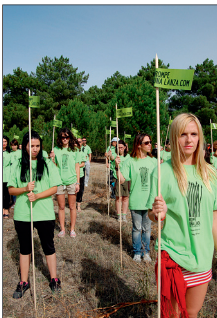
Protest tegen Toro de la Vega in Tordesillas

We kunnen u alvast informeren dat we weer zullen meedoen aan het protest in Tordesillas tegen 'Toro de la Vega' in September. Tijdens 'Toro de la Vega' wordt een stier door honderden mannen op paarden met lanssen gestoken tot de dood volgt. Waarschijnlijk zal het protest op de tweede zondag van september plaatsvinden. U kunt zich alvast opgeven door te mailen naar info@cas-international.org of te bellen naar 030 - 230 00 93. Ook zullen we hier meer informatie over geven in toekomstige BULLETINS.