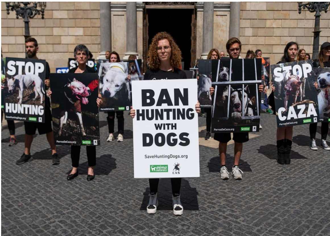
Een protest tegen de jacht met honden in Barcelona.

Uiteraard zijn wij ook in 2023 doorgegaan met aandacht vragen voor het lot van de jachthonden en de wilde dieren die op een vreselijke manier aan hun einde komen tijdens jachtpartijen in Spanje. We hebben samen met AnimaNaturalis protesten georganiseerd in onder andere Barcelona en Valencia. Ook hebben we meegedaan aan het grote jaarlijkse protest voor het einde van de jacht met honden op 4 februari. Dit protest werd georganiseerd in 48 Spaanse en 28 andere Europese steden. Wij deden mee in Madrid, Barcelona, Valencia, Sevilla, Alicante, Palma de Mallorca en Zaragoza.