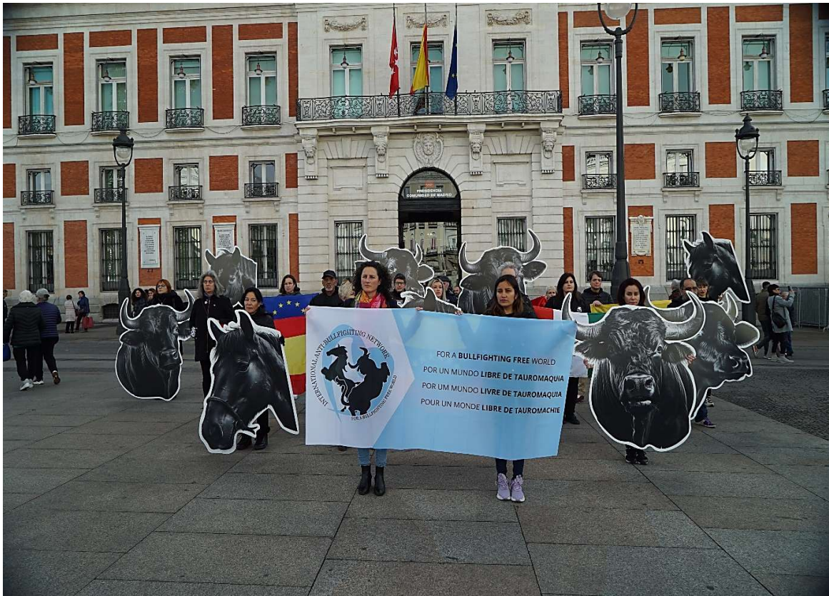
Protest tegen het stierenvechten in Madrid in november 2023.

Tot slot roepen we politici op om naar de samenleving te luisteren en actie te ondernemen om dieren te beschermen tegen het geweld van stierenvechten.