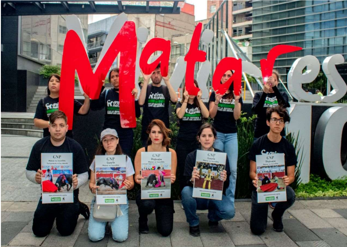
Demonstratie tegen stierenvechten voor het hoofdkantoor van verzekeringsmaatschappij GNP in Mexico-stad.