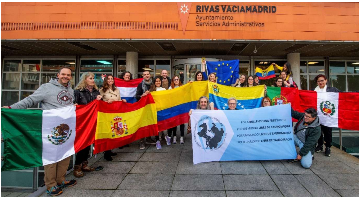
Foto tijdens de summit in Madrid in november 2023.

Voor het Internationale Netwerk tegen het Stierenvechten, dat actief is in 15 landen en 100 leden heeft, voert CAS International het secretariaat. CAS is bovendien medeoprichter van het Netwerk dat sinds 2007 bestaat. Ook organiseren we de jaarlijkse summit, zo ook in 2023. De summit vond dit keer plaats op 25 en 26 november in Rivas Vaciamadrid (vlakbij Madrid). Rivas Vaciamadrid is een diervriendelijke gemeente en we hadden het genoeg dat de burgemeester zelfs kwam om haar steun aan onze beweging uit te spreken. Tijdens de tweedaagse summit hebben we de plannen voor een website van het Netwerk, die CAS International gaat maken en waarvoor al financiering is verkregen via de Lush Charity Pot, besproken. Ook hebben we een voorstel gedaan voor het aanpassen van de principes en de Code of Commitment van het Netwerk. Daarnaast zijn er voorstellen gedaan voor verschillende thematische werkgroepen.