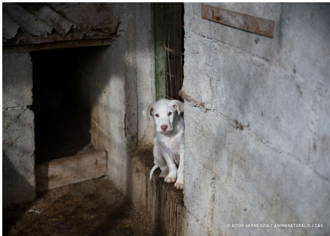
Een jachthondenpup in een van de fokkerijen voor jachthonden in Spanje.