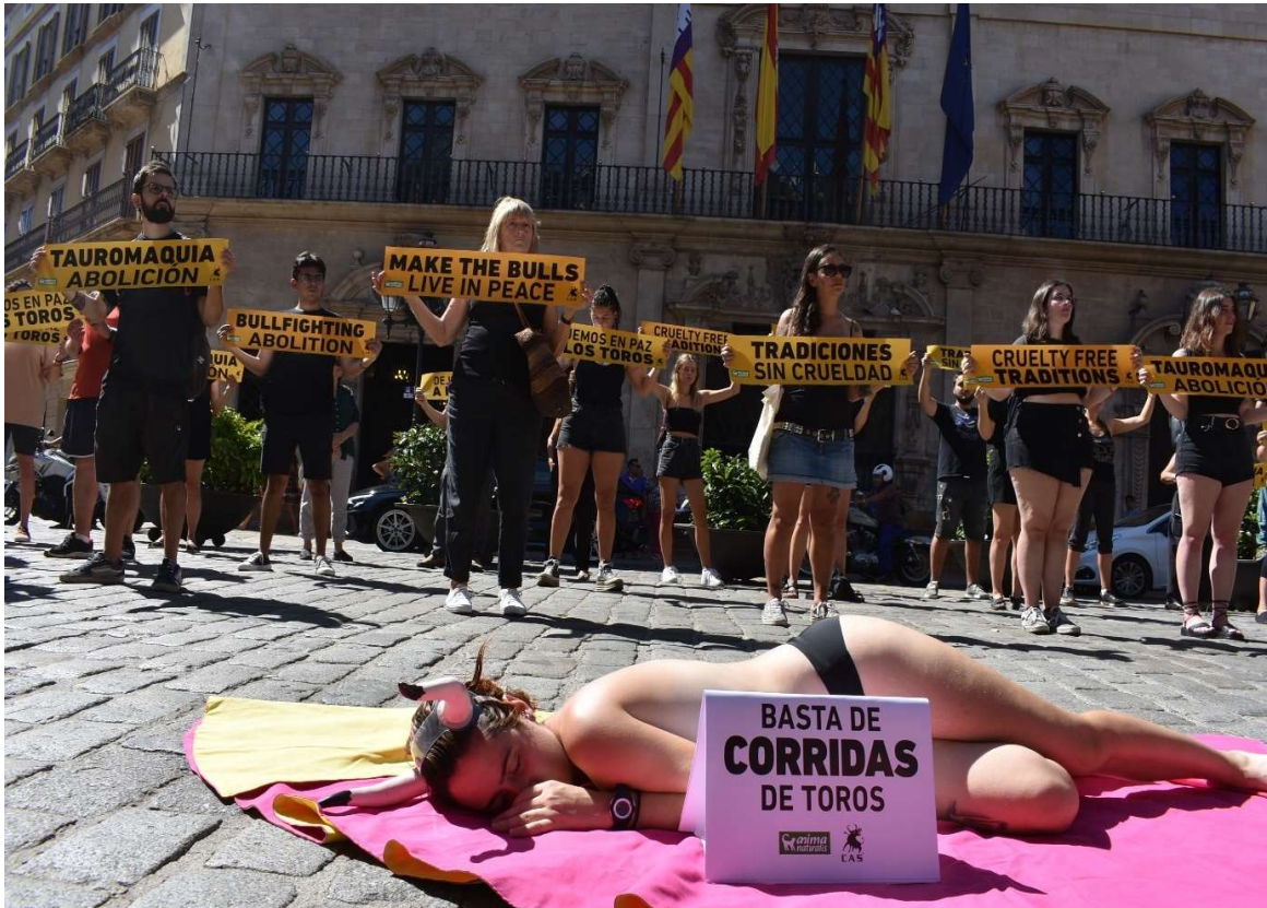
Een protest tegen stierenvechten in Palma de Mallorca.

In Madrid protesteerden we samen met AnimaNaturalis tegen wrede stierenfeesten toen ook de resultaten van het onderzoek naar de stierenfeesten zijn gepubliceerd.