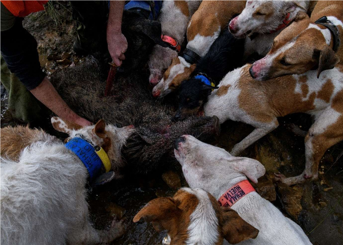
Een groep jachthonden valt een wild zwijn aan tijdens een van de 'monterías' die in Spanje plaatsvinden

In 2022 en 2023 hebben we beelden en video's naar buiten gebracht over het onderzoek dat we samen met AnimaNaturalis deden naar de omgang met jachthonden en wrede praktijken tijdens de traditionele jacht met honden in Spanje. Verschillende jachtpraktijken, waaronder traditionele 'monterías', zijn gedocumenteerd en er is beeldmateriaal van de fokkerijen en kennels waar jachthonden worden gefokt en gehouden onder erbarmelijke omstandigheden. Het onderzoek is het eerste onderzoek in Spanje hiernaar. Er is nooit eerder zo naar de jacht gekeken. Op www.savehuntingdogs.org is informatie te vinden en kan een petitie worden getekend.