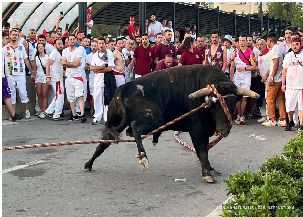
Een stier tijdens 'Toro Ensogado' in Teruel.