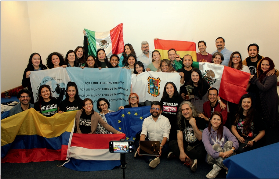
Deelnemers van de 16de summit tegen het stierenvechten in Mexico-Stad, november 2024.

Van 7 tot en met 13 november bracht CAS International een werkbezoek aan Mexico-Stad, waar we de 16de Internationale Summit tegen het stierenvechten hielden. Tijdens deze succesvolle conferentie kwamen vertegenwoordigers uit acht stierenvechtlanden en andere landen samen om de krachten te bundelen tegen deze wrede traditie. De Internationale Summit tegen het Stierenvechten wordt elk jaar door CAS International georganiseerd.