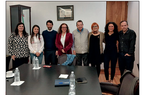
Lobbybijeenkomst met het Secretariaat van de Gouverneur van Mexico-Stad, november 2024.

Ook spraken we met senator Reyna Celeste Ascencio Ortega van de partij Morena. Deze bijeenkomst richtte zich op het opnemen van dierenrechten in de Mexicaanse grondwet.