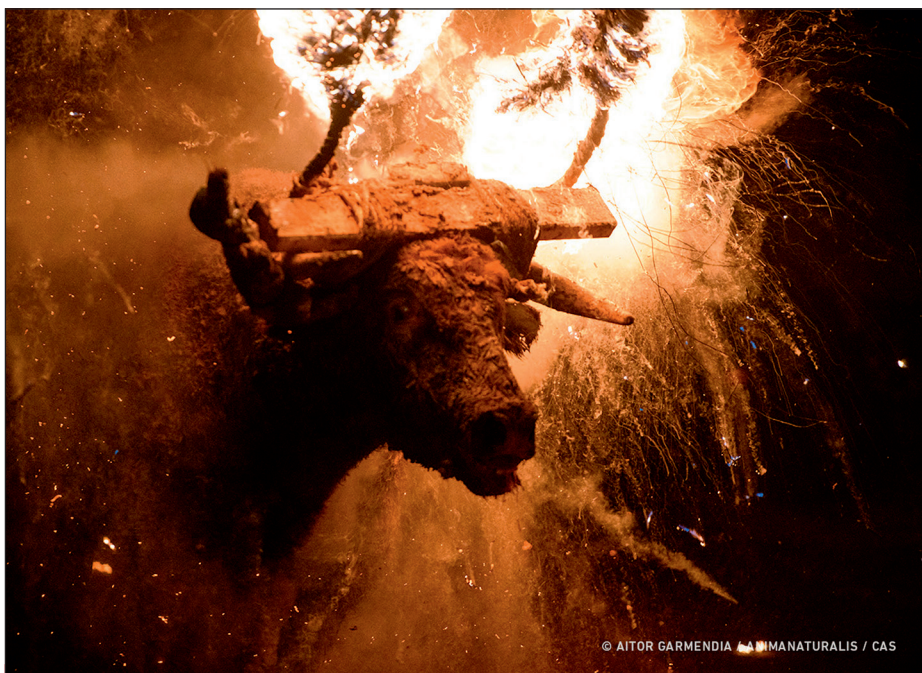
Toro Júbilo, 2022.