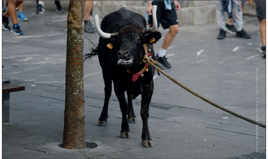
Sokamuturra, zomer 2024.

in Bilbao. Daarnaast filmden we hoe koeien worden behandeld tijdens de straatfeesten in Falces. Ook documenteerden we de Sokamuturra, een Baskische traditie waarbij stieren door de straten worden getrokken. Lees meer op onze website!